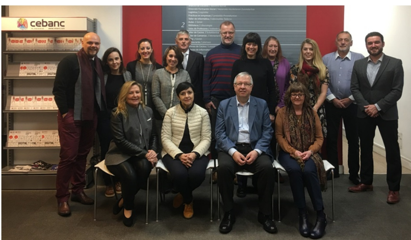
Projektni tim na prvem srečanju v San Sebastianu.

Partnerji v tem projektu so: CDEA (Španija), Errotu (Španija), Bridgwater in Taunton College (Velika Britanija), Age UK BANES (Velika Britanija), T2-Consulting (Velika Britanija), p-consulting (Grčija), Srednja šola za gostinstvo in turizem Maribor (Slovenija) in EfVET (Belgija). Drugi partner, Haaga-Helia (Finska), bo uporabil svoje strokovno znanje o sooblikovanju. Ekipa ima strokovnjake, ki že delajo s starejšimi in invalidi.