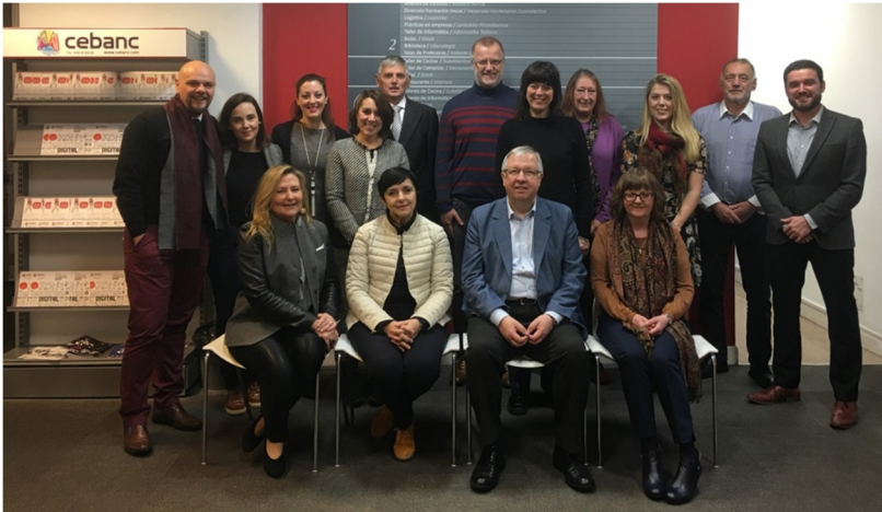
El equipo del proyecto durante la primera reunión en San Sebastián