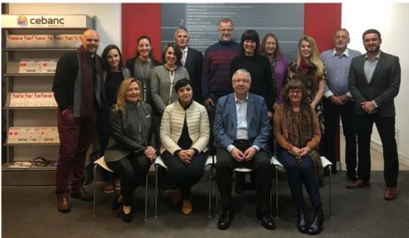
Proiektuko taldea Donostian ospatutako lehenengo bileran