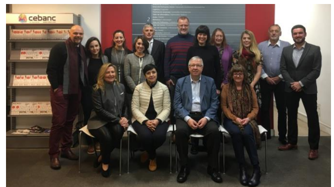
The project team at first meeting in San Sebastian

Στους εταίρους του έργου περιλαμβάνονται οι: CDEA (Ισπανία), Errotu (Ισπανία), Bridgwater και Taunton College (Ηνωμένο Βασίλειο), AGE UK BANES (Ηνωμένο Βασίλειο), T2-Consulting (Ηνωμένο Βασίλειο), p-consulting (Ελλάδα) Maribor Tourism School (Σλοβενία) και EfVET (Βέλγιο). Ένας άλλος εταίρος, το Haaga-Helia (Φινλανδία), θα παρέχει την τεχνογνωσία του στο co-design. Η ομάδα διαθέτει ειδικούς που εργάζονται ήδη με ηλικιωμένους και άτομα με ειδικές ανάγκες.