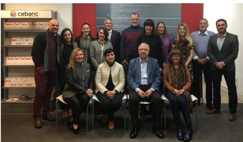
Projektni tim na prvem srečanju v San Sebastianu.

Partnerji v tem projektu so: CDEA (Španija), Errotu (Španija), Bridgwater in Taunton College (Velika Britanija), Age UK BANES (Velika Britanija), T2-Consulting (Velika Britanija), p-consulting (Grčija), Srednja šola za gostinstvo in turizem Maribor (Slovenija) in EfVET (Belgija). Drugi partner, Haaga-Helia (Finska), bo uporabil svoje strokovno znanje o sooblikovanju. Ekipa ima strokovnjake, ki že delajo s starejšimi in invalidi.